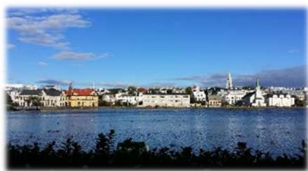
Reykjavik, Standort des 2. Meetings

Ein wichtiger Teil des Job Broker Projektes ist die „Transnationale Forschungsstudie - Richtlinien, Systeme und Bedarfsanalyse“. Darin werden die Länderberichte von Partnern aus Großbritannien, Deutschland, Island, Zypern, Spanien, Italien, Griechenland und Österreich kombiniert. Das in diesen Berichten dargelegte Schlüsselinformationswissen sowie lokale und regionale Themen unterstützen die Entwicklung des Job-Broker-Berufsprofils und des Curriculum-Programms.